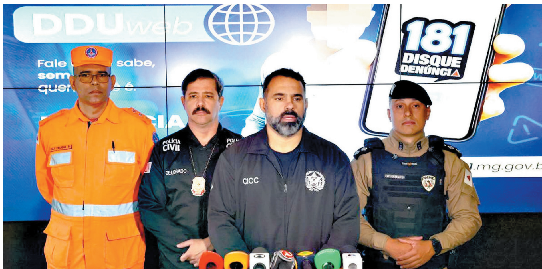
Nova plataforma do Disque Denúncia permite envio pela internet com fotos, vídeos e documentos