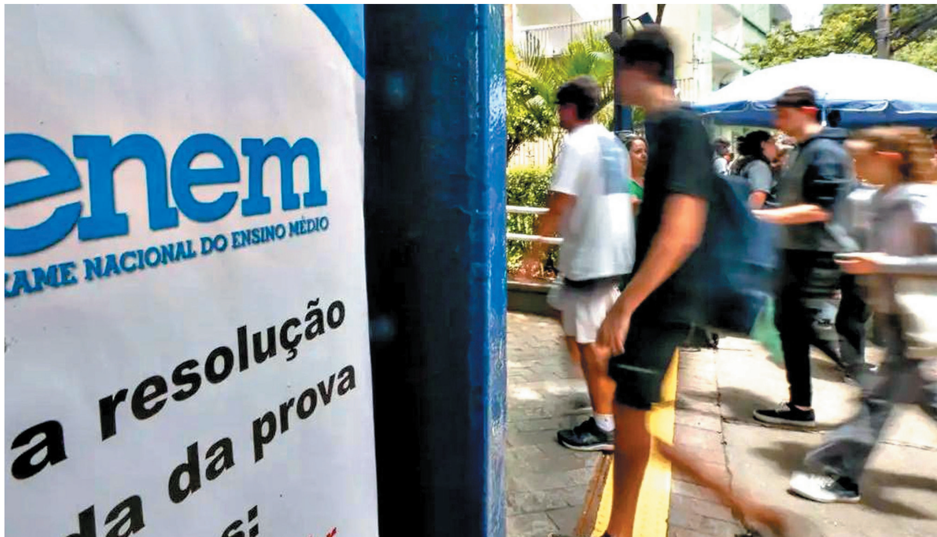
Prazo para inscrições do Enem 2026 termina nesta sexta, Dia dos Namorados