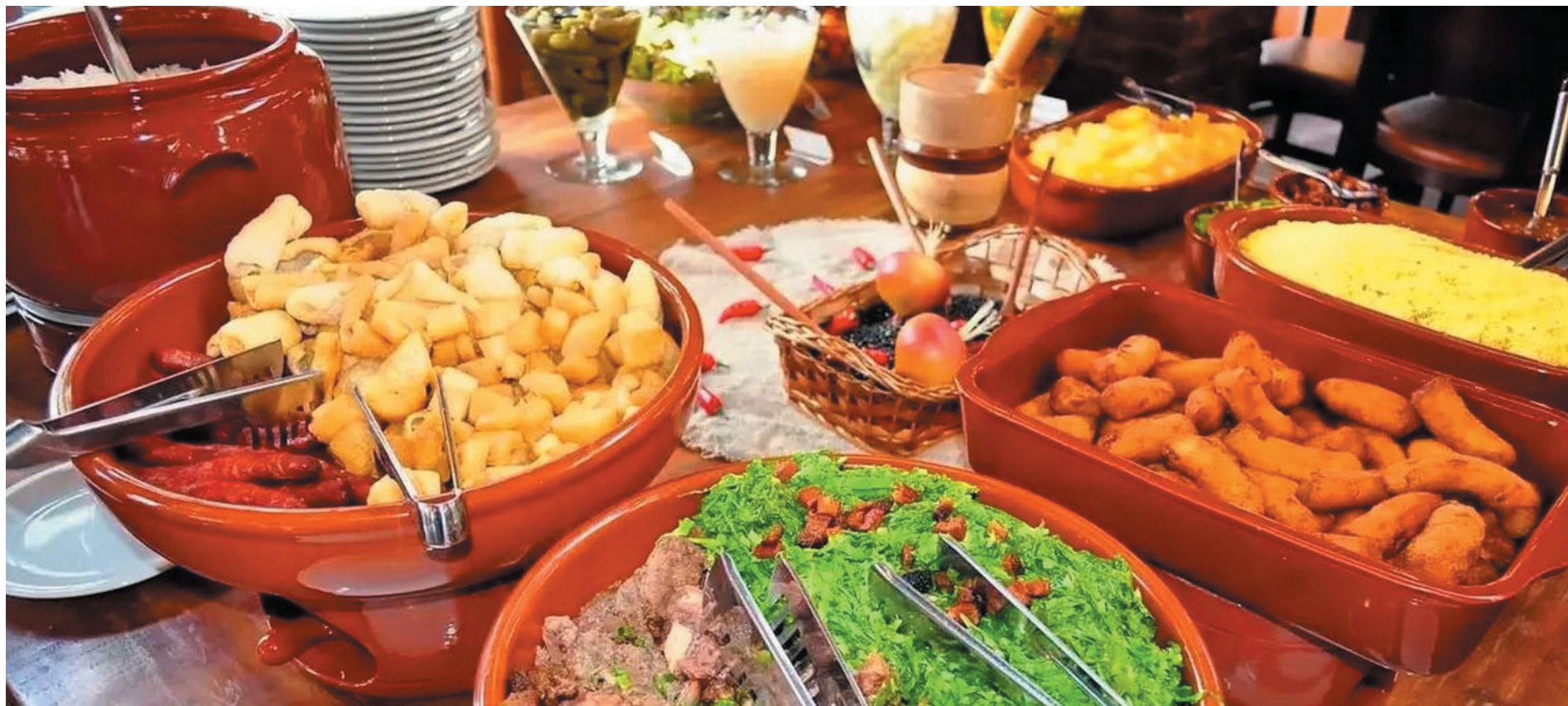
Efeito de remédios emagrecedores altera consumo em restaurantes