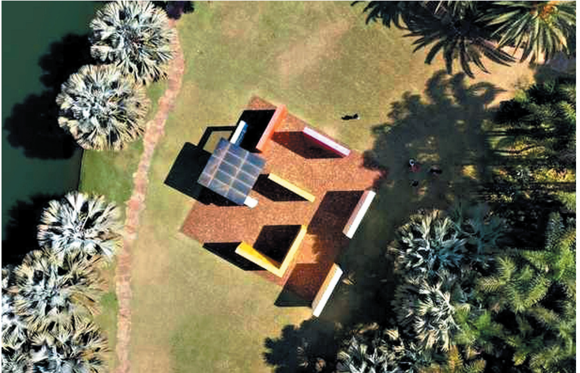
Seminário Internacional Transmutar reúne pesquisadores, artistas e especialistas de diversos países no Inhotim

ANALUÍSA RIBEIRO | aribeiro@hojeemdia.com.br