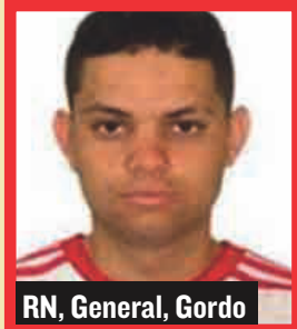
RN, General, Gordo