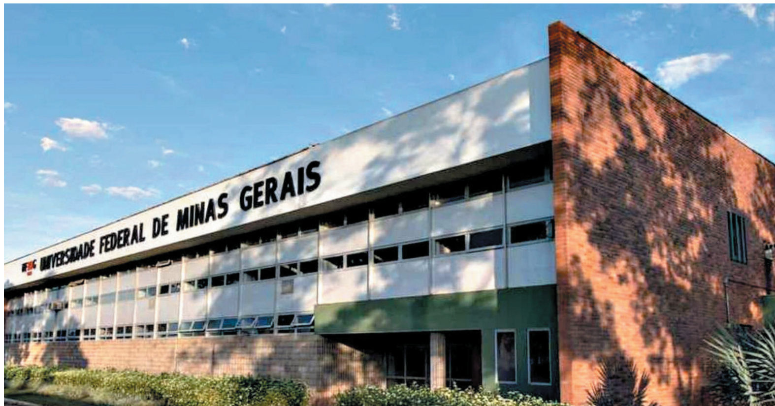
Universidades federais mineiras perderam posições no ranking Global 2000, divulgado pelo CWUR nesta segunda-feira

A edição de 2026 foi divulgada nesta segunda-feira (1) e mostrou que a queda não se restringe ao Estado. 45 das 52 universidades brasileiras presentes na lista re-