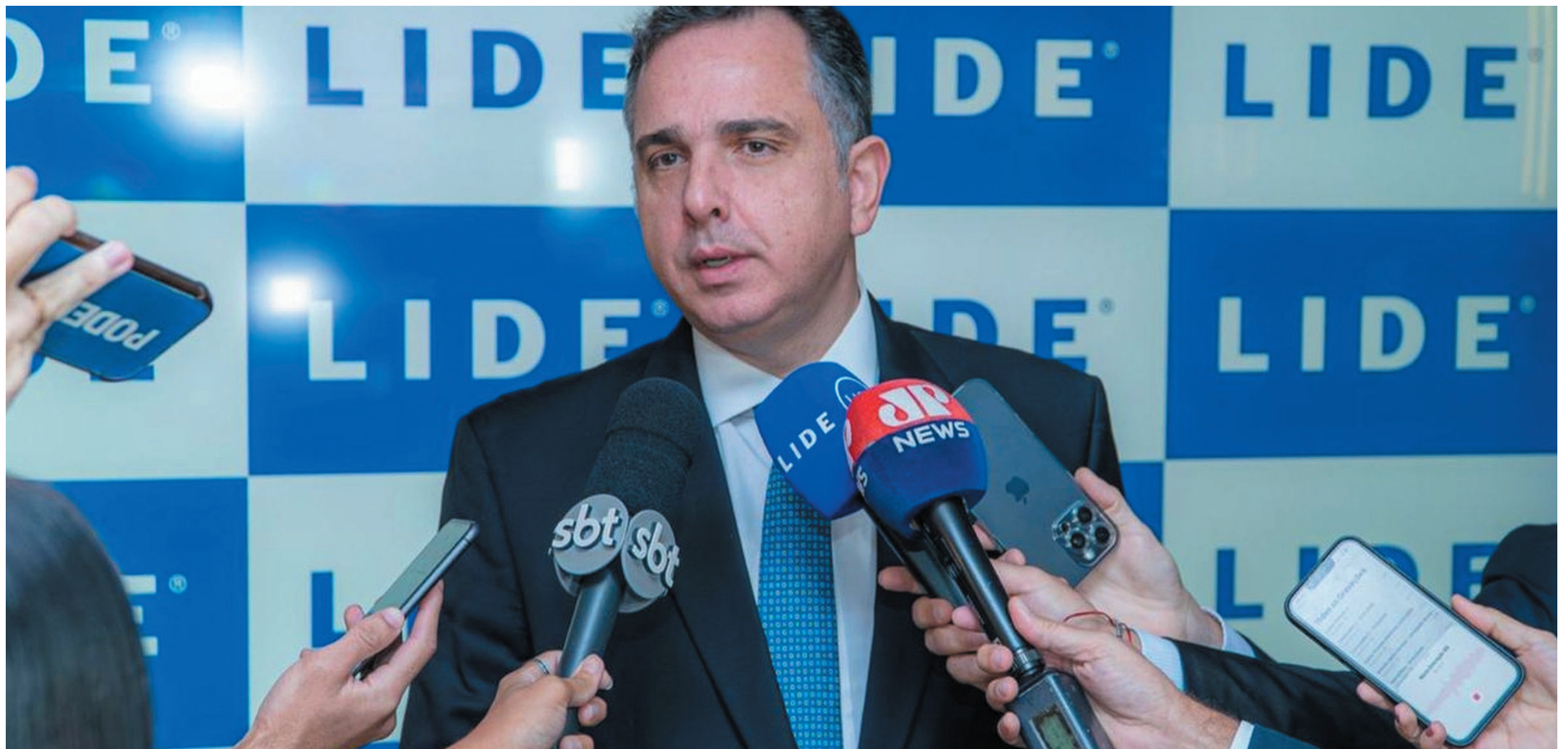
Rodrigo Pacheco afirmou que pretende encerrar sua trajetória política após 12 anos de vida pública e descartou disputar o Governo de Minas em 2026