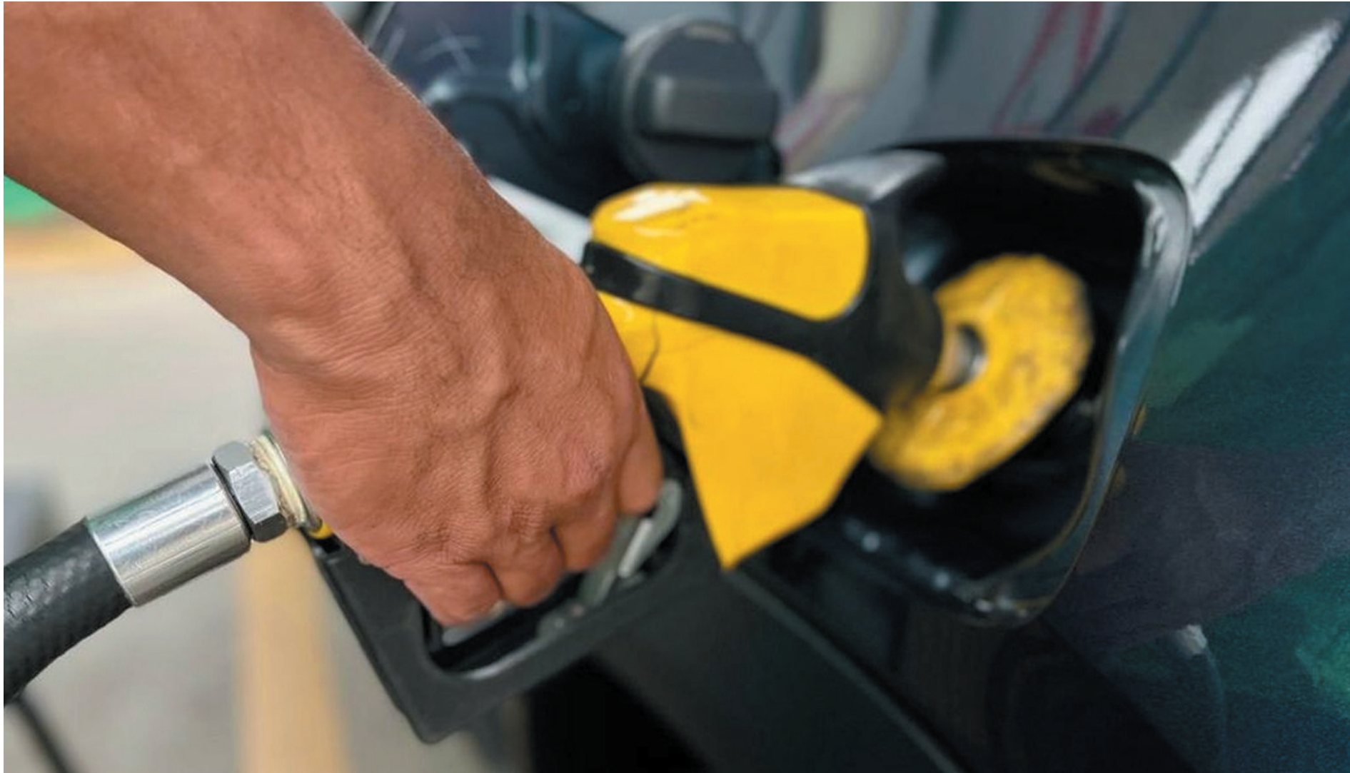
Gasolina foi vendida a R$ 3,64 por litro, valor R$ 1,90 abaixo do preço normalmente praticado, de R$ 5,54