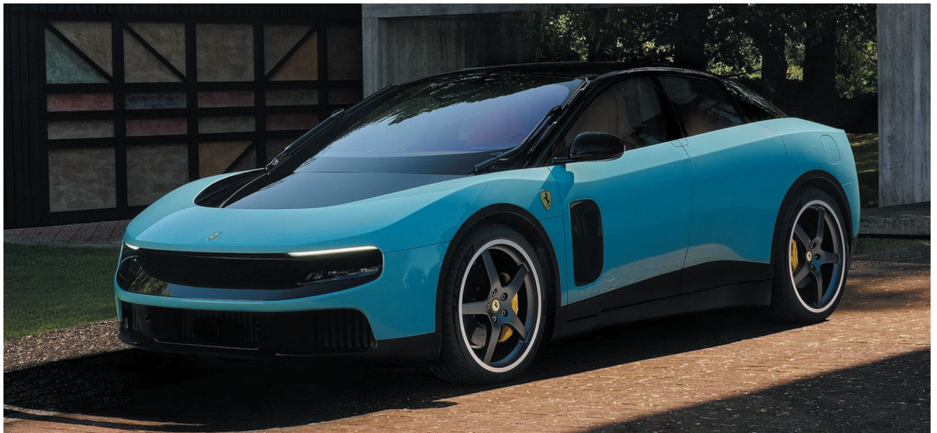
Ferrari Luce marca a estreia do primeiro modelo elétrico da marca, que lança mão do rugido metálico de seus V12 e V8, mas promete acelerar a até 310 km/h